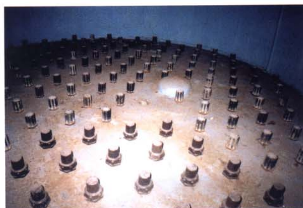
Vnitřní vestavba pískového filtru PFZ