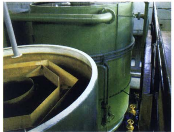
Atmosférický pískový filtr otevřený

pracuje na stejném principu jako filtr tlakový s tím rozdílem, že plášť filtru tvoří otevřená nádoba a voda prostupuje náplní gravitačně. Tím se šetří energie za cenu nutnosti zvětšit filtrační plochu. Materiálové provedení je opět kombinace uhlíkaté nebo nerezové oceli a plastu.