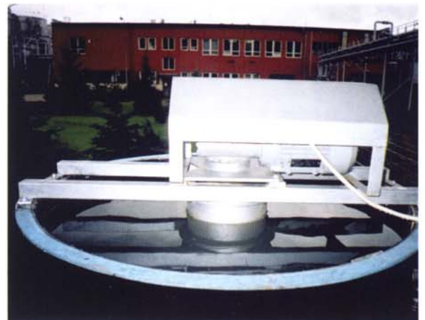
Pískový kontinuální filtr VIVASAND

Při procesu filtrace proudí znečištěná voda, přivedená do pískového lože středovou rourou a rozváděcími rameny, přes pískové lože do horní části filtru a odtud přepadem do odtoku přefiltrované vody.