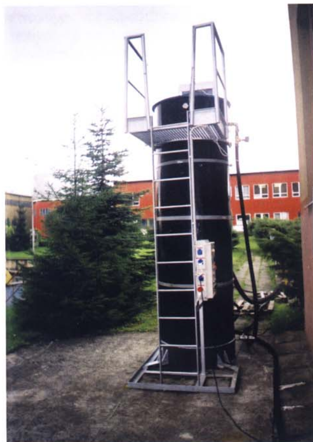
Kontinuální pískový filtr v papírně, ČR

Při čištění odpadních vod se pískové filtry uplatňují jako poslední stupeň terciálního dočištění, především v oblastech, kde je vyčištěná voda využívána pro závlahy nebo jako voda užitková. Také v této oblasti se jednoznačně projevuje přínos kontinuálních pískových filtrů VIVASAND.