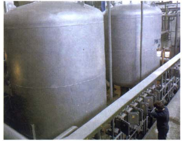
Tlakový pískový filtr zavřený

je tvořen tlakovou nádobou, ve které je umístěna vestavba, zabezpečující funkci filtru. Vestavba je tvořena mezidnem s tryskami, horním a dolním rozvodným systémem a rozvodem tlakového vzduchu. Filtr pracuje ve třech režimech: filtračním, pracím a režimu zafiltrování. Při filtraci prostupuje voda přes filtrační vrstvu a mezidno s tryskami. Při zanesení filtrační náplně se provede praní filtru. Pomocí prací vody a vzduchu se náplň vyčistí opačným prouděním než probíhá filtrace. Materiálové provedení je z uhlíkaté nebo nerezové oceli a plastu. Tlakové filtry mohou být též dodávány ve vícevrstevném provedení.